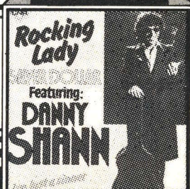
Silver Dollar featuring Danny Shann Rocking Lady Single 141.584