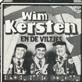
Wim Kersten Bloemetjes gordijn Single 141.588