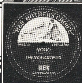
Monotones Mono Single 141.580